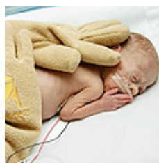
Zaky. תחושת אדם